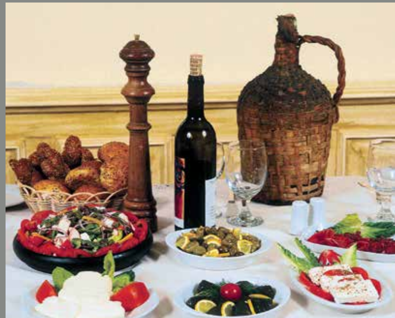
▲ Η μεσογειακή κουζίνα θεωρείται από τις καλύτερες του κόσμου.

► "Τράπεζα" ή μοναστηριακή τραπεζαρία της Μονής Μαχαιρά.