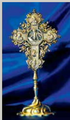
▲ Ασημένιος σταυρός με Τίμιο Ξύλο.

▲ Εξαιρετο δείγμα Βυζαντινής τεχνοτροπίας του 6ου μ.χ. αιώνα: Το περίφημο ψηφιδωτό της αψίδας του ιερού της εκκλησίας Παναγίας Αγγελόκτιστης, στο Κίτι.