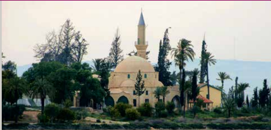
▶ Ένα ιδιαίτερα αξιόλογο μνημείο, το τέμενος Ουμ Χαράμ κτισμένο στις όχθες της Αλυκής στην Λάρνακα δηλώνει τη σχέση της τοποθεσίας αυτής ακόμα και με τον ίδιο τον Μωάμεθ.