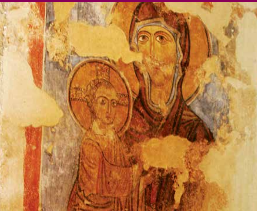
◀ Το Εικονοφύλακιο της εκκλησίας Αγίων Βαρνάβα και Ιλαρίωνος με τοιχογραφία της Παρθένου Μαρίας.