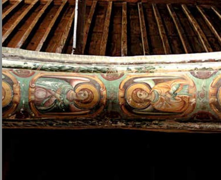
▲ Περίτεχνες αιογραφίες στο αέτωμα του ναού Παναγίας της Ιαματικής.

ΔΕΙΓΜΑΤΑ ΛΑΤΡΕΥΤΙΚΗΣ ΕΚΦΡΑΣΗΣ ΜΙΑΣ ΛΑΜΠΡΗΣ ΚΑΙ ΠΛΟΥΣΙΑΣ ΠΟΡΕΙΑΣ