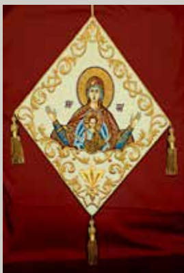
▲ Επιγονάτιο που εκτίθεται σε μουσείο.