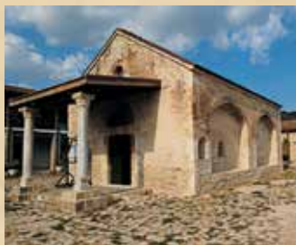
▲ Μονή Αρχαγγέλου Μιχαήλ, Μονάγρι.