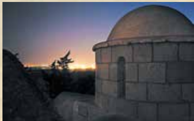
▲ Εκκλησία Αγίου Γεωργίου Χορτακιών.