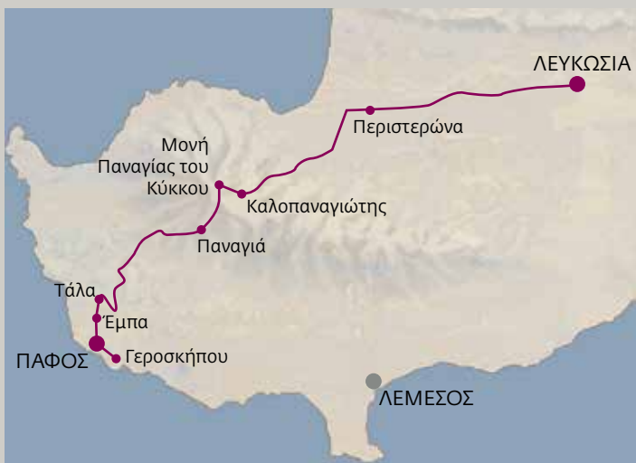
◀ Μονή Παναγίας του Κύκκου.