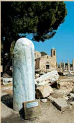
▲ Στήλη Αποστόλου Παύλου, Πάφος.