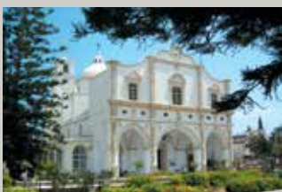
▶ Καθολική εκκλησία Τέρρα Σάντα, Λάρνακα.

Σε πολλές περιοχές της Κύπρου, ο επισκέπτης έχει την ευκαιρία να συναντήσει μνημεία λατρείας και κτίσματα διαφορετικών θρησκειών και δογμάτων. Μουσουλμανικά τεμένη και Εκκλησίες άλλων δογμάτων συνυπάρχουν ειρηνικά σε ένα διαρκή διάλογο, αναδεικνύοντας τη σπάνια και πλουσιότατη ιστορία και παράδοση αυτού του τόπου.