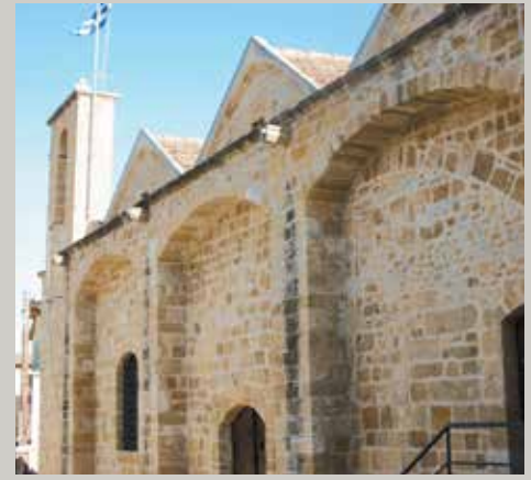
▲ Ναός Αγίου Κασσιανού.

Συναρπαστικά αχνάρια της ιστορίας και του πολιτισμού... Μιας ιστορίας που συνδέεται με την διάδοση του Χριστιανισμού στο νησί και από εδώ στο άνοιγμα του σε ολόκληρο τον κόσμο.