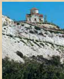
▲ Παρεκκλήσι Μονής Αγίου Γεωργίου Αλαμάνου.