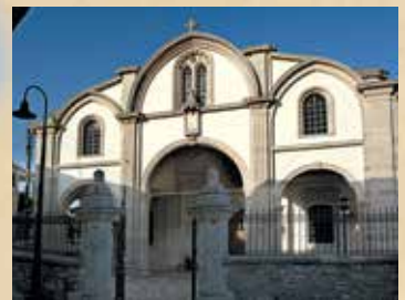
▲ Εκκλησία Τιμίου Σταυρού, Λεύκαρα.