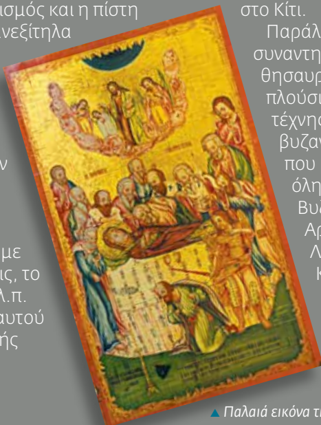
▲ Παλιά εικόνα της εκκλησίας Αγίων Βαρνάβα Και Ιλαρίωνος.

Παράλληλα, ο επισκέπτης μπορεί να συναντηθεί με τους εκκλησιαστικούς θησαυρούς της Κύπρου και μέσα από τις πλούσιες συλλογές έργων βυζαντινής τέχνης, που εκτίθενται στα διάφορα βυζαντινά Μουσεία και σκευοφυλάκια που βρίσκονται κατάσπαρτα σε όλη την Κύπρο, όπως είναι το Βυζαντινό Μουσείο του Ιδρύματος Αρχιεπισκόπου Μακαρίου Γ' στη Λευκωσία, το Μουσείο Ιεράς Μονής Κύκκου, το Βυζαντινό Μουσείο Πάφου, το Εικονοφύλακιο της Ιεράς Μονής Αγίου Ιωάννου Λαμπαδιστή, κ.α.