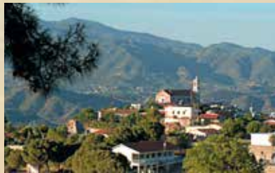
▲ Εκκλησία Αγίου Γεωργίου, Κελλάκι.