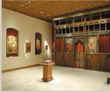
▲ Μουσείο Μονής Αγίου Ιωάννη Λαμπαδιστή.