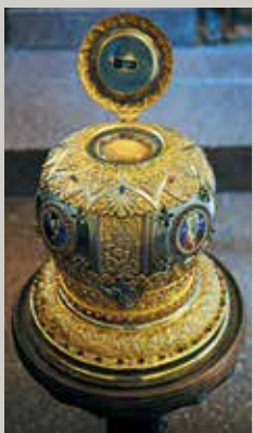
▲ Η κόρα του Αγίου Ηρακλειδίου στην ομώνυμη μονή.