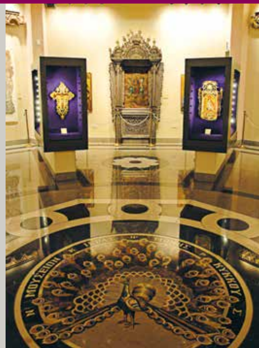
▶ Το Μουσείο Ιεράς Μονής του Κύκκου : Χώρος στον οποίο ο επισκέπτης μπορεί να θαυμάσει ανεκτίμητα έργα τέχνης.