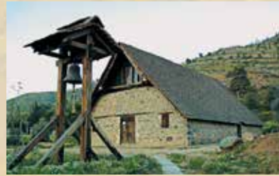
▲ Εκκλησία Αρχαγγέλου Μιχαήλ Γαλάτα.

Ο Θεός "προίκισε" την Κυπραία γη με εντυπωσιακά τοπία και ιδιαίτερες φυσικές ομορφιές. Δαντελωτές ακτές, καταγάλανα ακρογιάλια, επιβλητικά βουνά, καταπράσινα δάση, βιότοπους εξαιρετικής ομορφιάς και μοναδικά οικοσυστήματα και όλα αυτά λουσμένα στο φως του ήλιου. Παράλληλα, η πίστη των κατοίκων της Αγίας Νήσου την κέντησαν και την στόλισαν με αμέτρητα μνημεία και τόπους έκφρασης της θρησκευτικής ευλάβειας. Μνημεία μάρτυρες μιας τεράστιας ιστορικής διαδρομής. Η Κύπρος έχει τόσα πολλά να προσφέρει στον επισκέπτη – προσκυνητή, που ο χρόνος ενός μόνο ταξιδιού φαντάζει υπερβολικά μικρός.