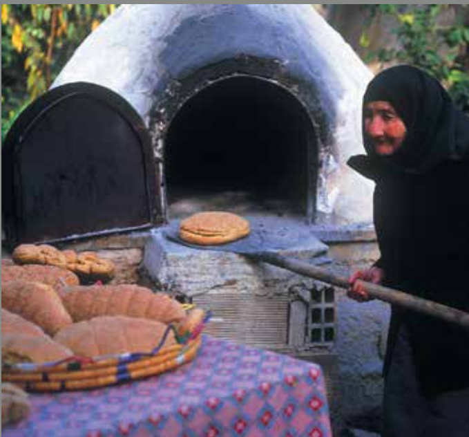
▲ Παραδοσιακό ψήσιμο ψωμιού.

επισκέπτης θα βρει εκατοντάδες καφεinedάκια κάτω από τη σκιά κάποιου πεύκου ή μιας κληματαριάς για ένα καφέ, καθώς και δεκάδες ταβερνάκια να σερβίρουν κάποιο νόστιμο κυπριακό μεζέ.