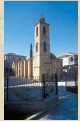
▲ Καθεδρικός Ναός Αγίου Ιωάννη, Λευκωσία.