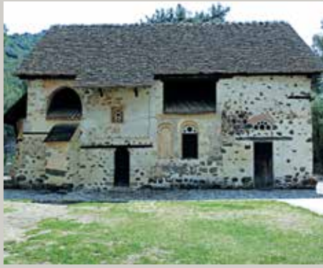
▲ Ναός Αγίου Νικολάου Στέγης.