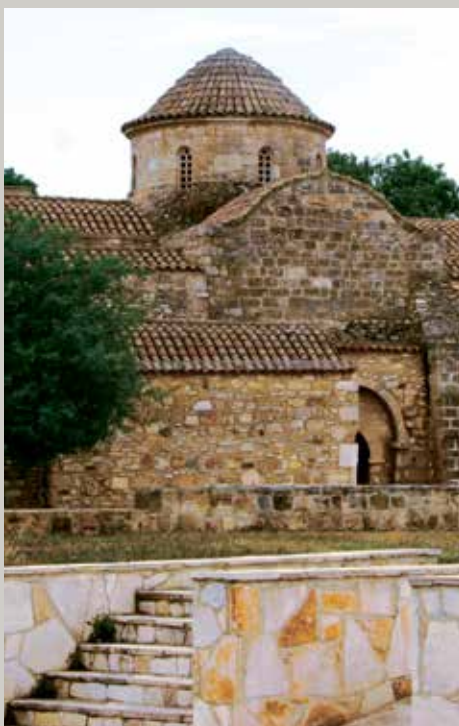
▲ Ναός Παναγίας Αγγελόκτιστης, Κίτι.