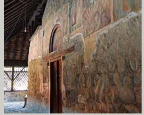
▲ Μονή Παναγίας του Άρακα.