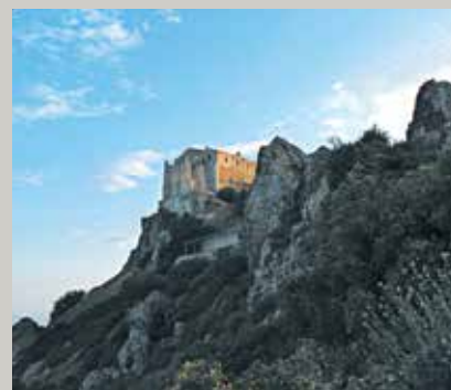
▲ Μονή Σταυροβουνίου.

Σταθμός για την τιμή και ευλάβεια προς τον Τίμιο Σταυρό αποτελεί η κάθοδος στην Κύπρο της Αγίας Ελένης, η οποία επιστρέφοντας από τους Αγίους Τόπους, αγκυροβολεί στο νησί, κτίζει τη μονή Σταυροβουνίου και την προικίζει με κομμάτι από τον Τίμιο Σταυρό, ήλους, καρφιά με τα οποία κάρφωσαν τον Χριστό στο Σταυρό, καθώς και με το Σταυρό του ευγνώμονος ληστού. Παράλληλα, η Αγία Ελένη αφήνει στην Κύπρο και κομμάτι από την Ιερή Κάνναβο, το σκονί με το οποίο έδεσαν τα χέρια του Ιησού, οδηγώντας Τον προς το Σταυρό.