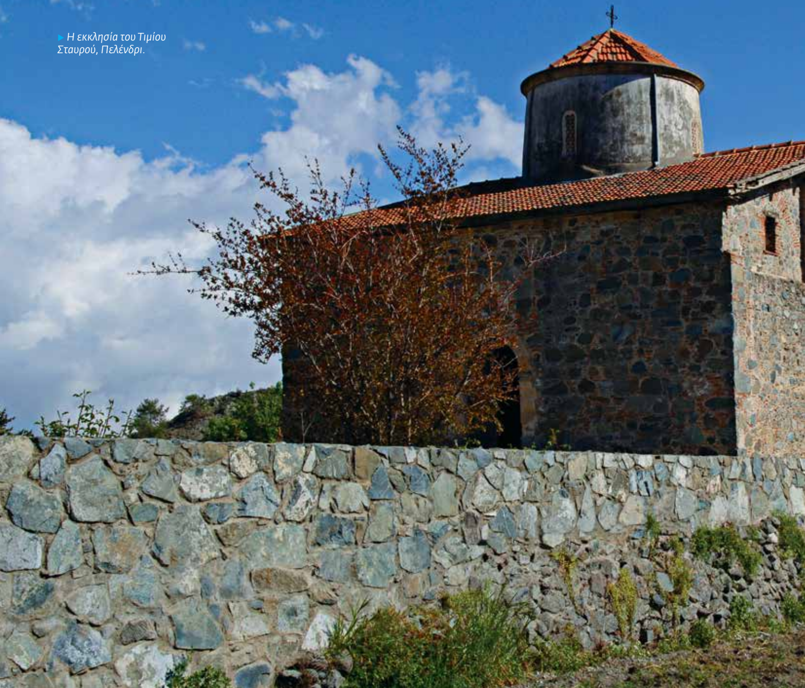
► Η εκκλησία του Τιμίου Σταυρού, Πελένδρι.