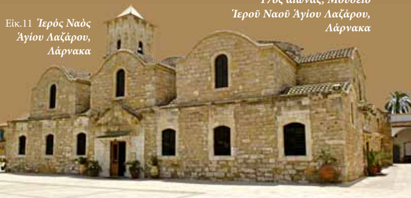
Εικ.11 Ἱερός Ναός Ἁγίου Λαζάρου, Λάρνακα