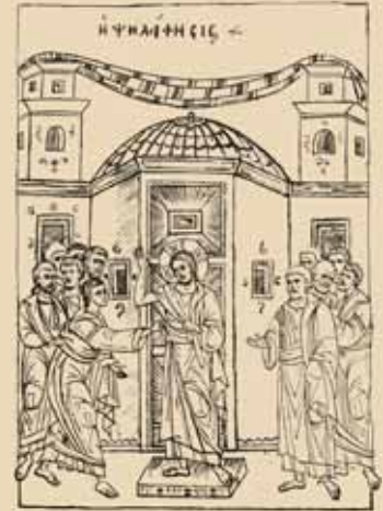
Εικ.57 Ἡ Ψηλάφηση

Ἡ πρώτη Κυριακὴ μετὰ τὸ Πάσχα εἶναι ἡ Κυριακὴ τοῦ Θωμᾶ . Εἶναι ἡ παρουσία τοῦ Χριστοῦ σὲ μᾶς, συνηγμένους στὴν Ἐκκλησία τῶν «θυρῶν κεκλεισμένων», καὶ μᾶς δείχνει πῶς ἐμεῖς πρέπει νὰ ἀνταποκριθοῦμε σ' αὐτὴν τὴν παρουσία καὶ πῶς πρέπει νὰ συναντήσουμε τὸν Χριστό.