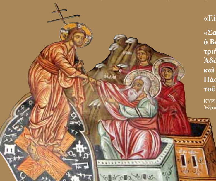
Εἰκ.45 Καλόν Λόγον, ὁ λαὸς τῆς Κύπρου ἐννοεῖ το τροπάριο, «Τὴν Ἀνάστασίν σου, Χριστέ Σωτήρ...»