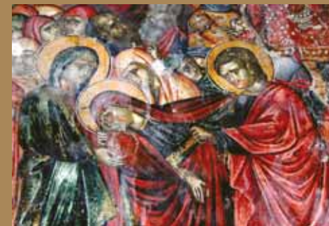
Εἰκ.32 Τοιχογραφία, Ἱερός Ναὸς Ἁγίας Παρασκευῆς, Γεροσκήπου.