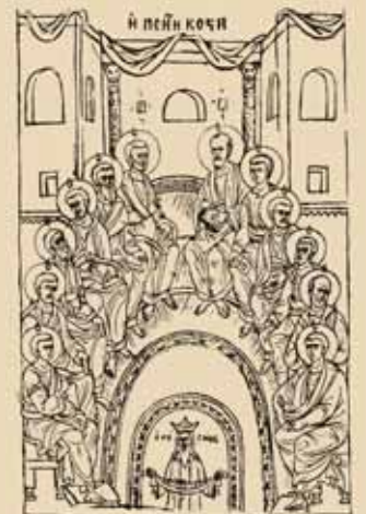
Εικ.59 Ἡ Πεντηκοστὴ

Ἡ Κυριακὴ τῶν Μυροφόρων περιγράφει τὸ θεῖο ἔρωτα ποῦ πρέπει νὰ φλογίζει τὴν καρδιά τοῦ ἀνθρώπου γιὰ νὰ ἐπιτύχει αὐτὴν τὴν συνάντηση.