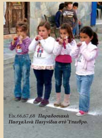
Εικ.66,67,68 Παραδοσιακὰ Πασχαλινὰ Παιγνίδια στὸ Ὑπαιθρο.