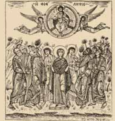
Εικ.58 Ἡ Ανάληψις