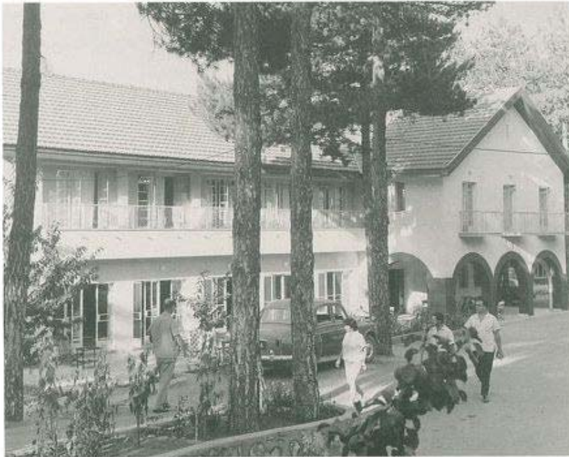
TO ANAKAINIMENO ΞΕΝΟΔΟΧΕΙΟ PINWOOD VALLEY ΕΤΟΝ ΠΕΔΟΥΛΑ.