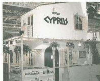
ΤΟ ΠΕΡΙΠΤΕΡΟ ΤΗΣ ΚΥΠΡΟΥ ΣΤΗΝ ΕΚΘΕΣΗ WORLD TRAVEL MARKET ΣΤΟ ΛΟΝΔΙΝΟ, ΣΤΟ ΟΠΟΙΟ ΣΥΜΜΕΤΕΙΧΕ ΚΑΙ Ο ΠΑΣΣΕ.