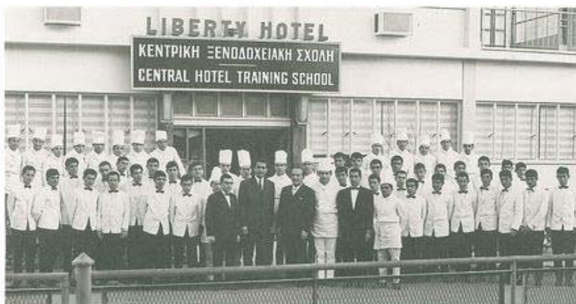
ΚΑΘΗΓΗΤΕΣ ΚΑΙ ΣΠΟΥΔΑΣΤΕΣ ΤΗΣ ΚΕΝΤΡΙΚΗΣ ΞΕΝΟΔΟΧΕΙΑΚΗΣ ΣΧΟΛΗΣ ΜΕ ΤΟΝ R. BERLENDIS, ΕΙΔΙΚΟ ΣΥΜΒΟΥΛΟ ΓΙΑ ΘΕΜΑΤΑ ΕΚΠΑΙΔΕΥΣΗΣ ΤΟΥ ΔΙΕΘΝΟΥΣ ΓΡΑΦΕΙΟΥ ΕΡΓΑΣΙΑΣ (I.L.O.).

και αυτοδύναμου οργανισμού με αποκλειστική αρμοδιότητα στα θέματα του τουρισμού. Πρωτοστάτησαν τότε στη μετάκληση από την Ελλάδα των Φωκά και Κορομηλά, ειδικών σε θέματα τουρισμού, για να προσφέρουν τα φώτα και τις γνώσεις τους στην προετοιμασία των νομοθετικών και άλλων διαδικαστικών πλαισίων για τη δημιουργία κυπριακού οργανισμού τουρισμού. Ο Σύνδεσμος τάχθηκε σθεναρά υπέρ ενός αυτοδύναμου οργανισμού με εκτελεστική εξουσία για