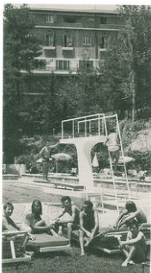
ΤΟ ΑΝΑΚΑΙΝΙΜΕΝΟ ΞΕΝΟΔΟΧΕΙΟ FOREST PARK ΣΤΙΣ ΠΑΛΤΡΕΣ.

δευτικές ανάγκες και, δεύτερον, τον αθέμιτο ανταγωνισμό που ασκούσε η ανεξέλεγκτη λειτουργία παράνομων τουριστικών καταλυμάτων.