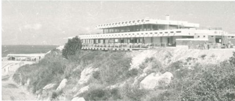
TO ΞΕΝΟΔΟΧΕΙΟ MARE MONTE ΣΤΟΝ ΚΑΡΑΒΑ