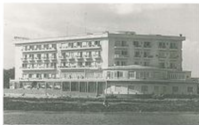
TO ΞΕΝΟΔΟΧΕΙΟ CONSTANTIA ΣΤΗΝ ΑΜΜΟΧΩΣΤΟ.