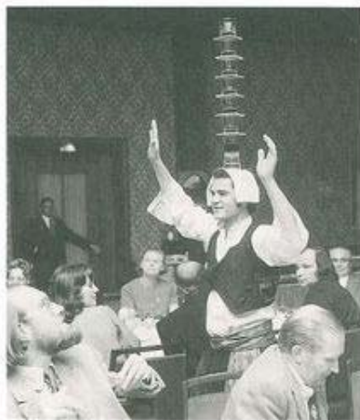
«ΚΥΠΡΙΑΚΗ ΒΡΑΔΥΑ» ΣΤΗ ΓΕΡΜΑΝΙΑ, ΣΤΑ ΠΛΑΙΣΙΑ ΕΚΔΗΛΩΣΗΣ ΓΙΑ ΤΟΥΡΙΣΤΙΚΗ ΠΡΩΒΟΛΗ ΤΗΣ ΚΥΠΡΟΥ.

Ο Σύνδεσμος αποδίδει ιδιαίτερη προσοχή αυτή την εποχή σε θέματα προβολής και εμπορίας του τουριστικού προϊόντος και αναλαμβάνει σειρά πρωτοβουλιών για ενίσχυση και αναβάθμισή τους. Οργανώνει απευθείας αποστολές στο εξωτερικό, κάνοντας αρχή με τη μεγαλύτερη αγορά της Κύπρου, το Ηνωμένο Βασίλειο, και στη συνέχεια τη Γερμανία και άλλες ευρωπαϊκές και μεσανατολικές χώρες. Αξίζει να αναφερθεί ότι ο Σύνδεσμος έδειξε ιδιαίτερη ευαισθησία στον τομέα της προβολής και του μάρκετινγκ, ενεργώντας με δικό του πρόγραμμα δράσης στο εξωτερικό, παράλληλα με εκείνο του ΚΟΤ. Εκτός από την οργανωμένη διαφήμιση στην οποία προβαίνει ο Σύνδεσμος σε έντυπα του εξωτερικού, δίδει το παρών του σε διάφορες τουριστικές εκδηλώσεις και συναντήσεις είτε μεμονωμένα είτε σε συνεργασία με τον ΚΟΤ. Επενδύει ιδιαίτερα στη συμμετοχή του σε τουριστικές εκθέσεις, κάνοντας αρχή με την Έκθεση του Ισραήλ, το 1969. Εκτοτε, διευρύνει και αναβαθμίζει την εκπροσώπησή του σε διεθνείς και περιφερειακές εκθέσεις με κύριο άξονα προβολής την Παγκόσμια Τουριστική Έκθεση του Λονδίνου "World Travel Market".