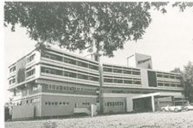
ΞΕΝΟΔΟΧΕΙΟ MIRAMARE. ΤΟ ΠΡΩΤΟ ΣΥΓΧΡΟΝΟ ΞΕΝΟΔΟΧΕΙΟ ΤΗΣ ΔΕΜΕΣΟΥ ΣΤΗΝ ΑΡΧΙΚΗ ΤΟΥ ΜΟΡΦΗ.

Ενα πρόβλημα που διευρυνόταν συνεχώς, με αποτέλεσμα την υπεξαίρεση προσωπικού από υφιστάμενες μονάδες και τη δημιουργία τεχνητής ανατίμησης των μισθολογίων. Μια εξέλιξη με απρόβλεπτες πληθωριστικές τάσεις και αρνητικές επιπτώσεις στην ξενοδοχειακή βιομηχανία.