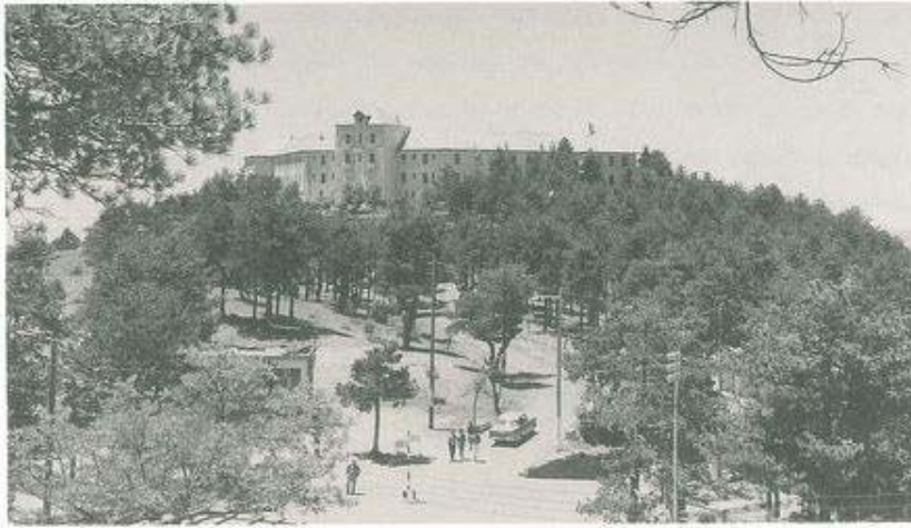
TO ANAKAINIMENO ΞΕΝΟΔΟΧΕΙΟ BERENGARIA ΕΤΟΝ ΠΡΟΔΡΟΜΟ.